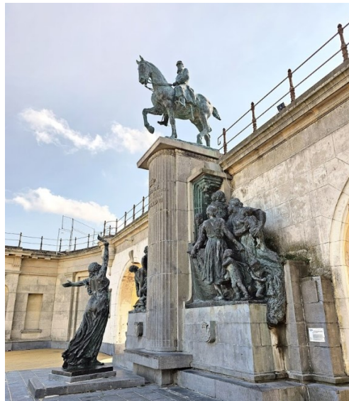
Monument Leopold II