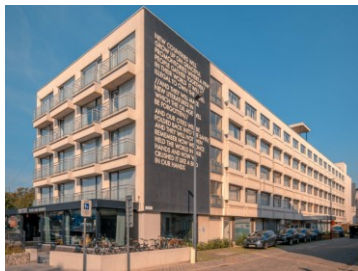
Hotel Royal Astrid Wellingtonstraat 15, 8400 Oostende, Belgien Tel: +32 59 33 96 96