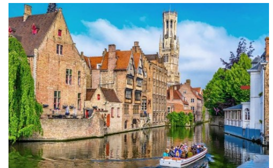
Grachtenfahrt auf den Kanälen in Brügge